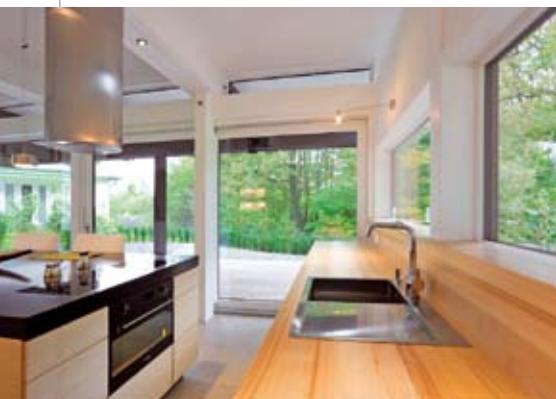
Ein Küchenarbeitsplatz wie er schöner nicht sein kann. Der Essplatz liegt direkt am Anschluss an die zentrale Kochinsel.

Raumgliederung sorgen. Rundumverglasungen bis zum Boden sowie Glasflächen in den Zwischenräumen der aufliegenden Deckenbalken schaffen besondere Lichteffekte. Schiebe-Fenstertüren öffnen die Räume nach draußen und ermöglichen so ein Wohnen inmitten der Natur. Ähn-