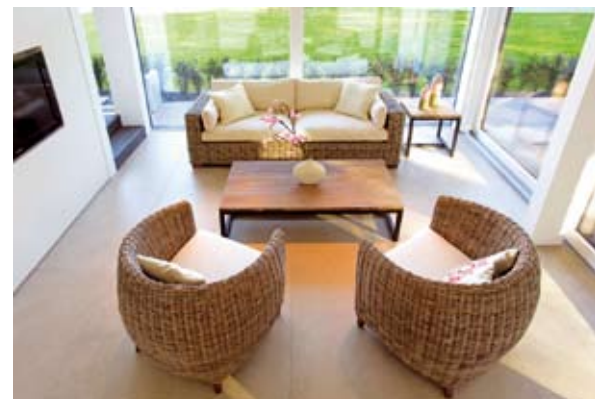
Eine leichte, variable Schiebewand trennt den Wohnbereich vom Essplatz und schafft eine gemütliche Sitzcke mit angrenzendem Lesezimmer.