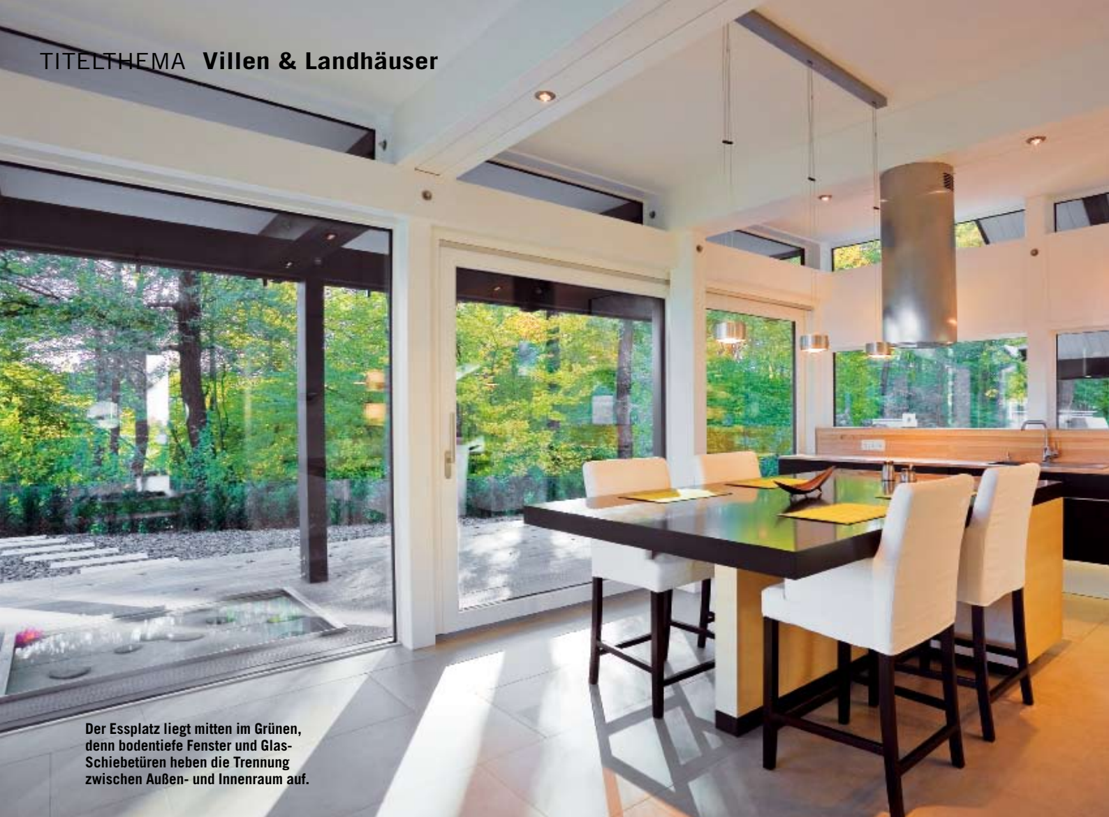
Der Essplatz liegt mitten im Grünen, denn bodentiefe Fenster und Glas-Schiebetüren heben die Trennung zwischen Außen- und Innenraum auf.

lässt sich der Lichteinfall das ganze Jahr über steuern. So verändern die Räume, aber auch Ausblicke in den Garten ständig ihr Gesicht – das Wohnen wird zum einmaligen Erlebnis.